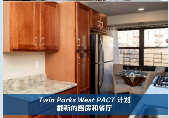
Twin Parks West PACT 计划 翻新的厨房和餐厅