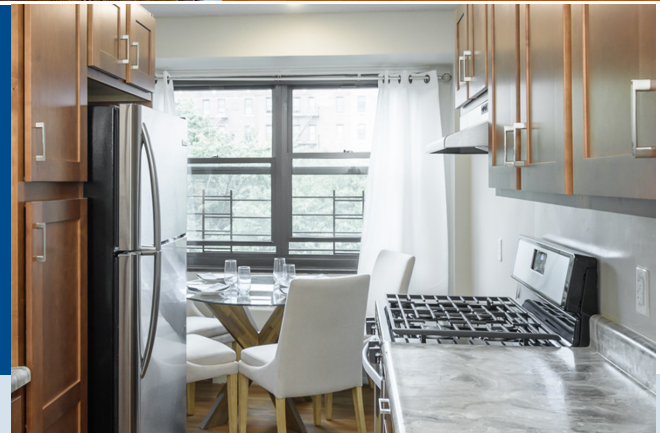
Twin Parks West PACT 计划 翻新的厨房和餐厅