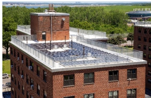
海洋湾（贝赛德）经修复的屋顶及太阳能板系统