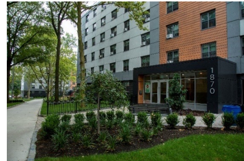
贝彻斯特的场地改造工程