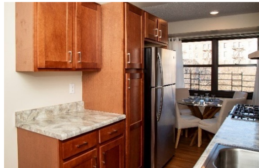
双子公园西经翻修的公寓